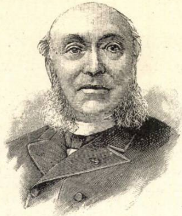
PÉRIVIER A TÖRVÉNYSZÉK ELNÖKE.